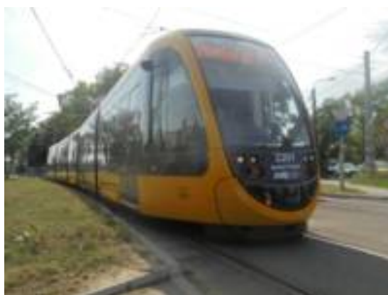
Határ út, Topánk Párizs útja, Topánka útja, Topánka felújítás, Gubacsi hat, Csuka útja, Ágy Erdős útja, II. Rákóczi Ferenc útja útjánál a jelenlegi HÉV végállomáig Picture 48dpi

Ha pedig villamost szeretnének Csepelre, akkor hozzák át a Gubacsi útról tovább a 3-as villamost, de ne a Csepeli HÉV helyett, hanem a Csepeli HÉV megtartása mellett!